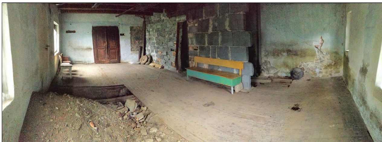
Ministrantská chaloupka 7/2020